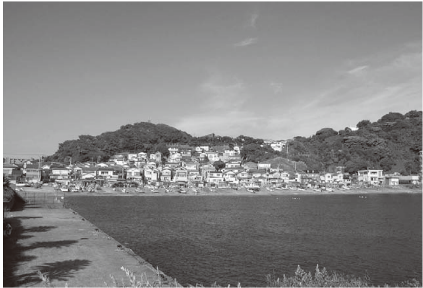
▲逗子市小坪漁港付近