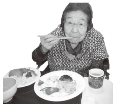
食事を楽しむ利用者さん

ング形式のメニューには、エビフライ・ハンバーグ・スクランブルエッグ・サラダやナポリタンにパン、デザートとしてアイスクリームです。いつもとは違う食事にみなさん目を輝かせていました。利用者さんからは、「職員さんと一緒に食事をするのは初めて。楽しみながら美味しく食べることができましたよ。とても嬉しい時間を過ごすことができました。97歳まで生きてよかったです」などと、嬉しい感想がもらえました。利用者さんからの言葉に、職員一同もニコニコ顔。みなさんに喜んでいただき大成功に終わりました。