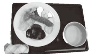
美味しそうに盛りつけられた食事