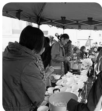
おしるこ無料配布！