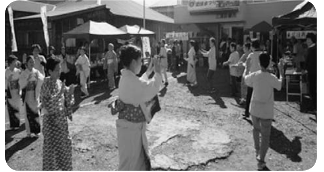
各団体による踊り