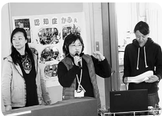
介護の講演も好評でした