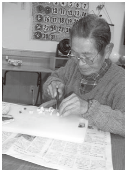
蒸しパン作りの様子

10月のレクリエーションは「アゴラ文化祭」でした。秋の味覚さつま芋を使った蒸しパン作りをしました。当初は、焼き芋を振る舞う予定だったのですが、めずらしく2週連続の台風に見舞われ てしまい、焼き芋は断念。芋たつぷりの蒸しパン作りでした。「子どもの頃よく食べたわ」「昔によく作ったの。懐かしいわ」と昔話を交えながら楽しく作りました。 午後からは催し物としてマジック披露です。台風の影響で出演者が来られるかどうか心配でしたが無事に到着、楽しいマジックを披露してくれました。利用者も参加したフォーク曲げでは見事に曲げることができ、みんなで驚きました。披露してくれたマジックは驚きの連続で、利用者はおどろくやら楽しむやら。台風というハプニングもありましたが、今回もみなさんの笑顔がたくさん見られました。