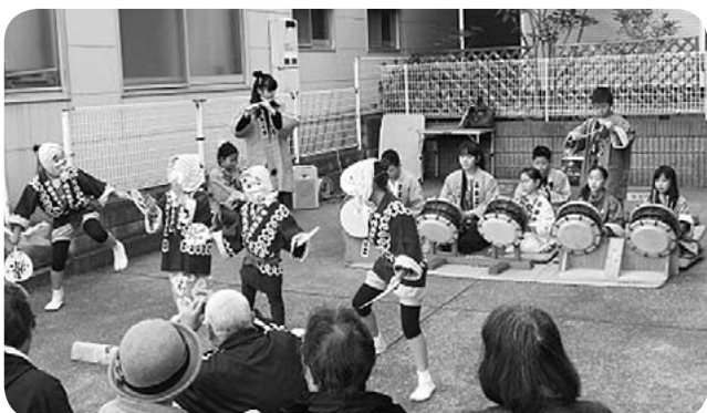
子ども太鼓によるオープニング