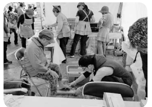
大人気の足指力測定