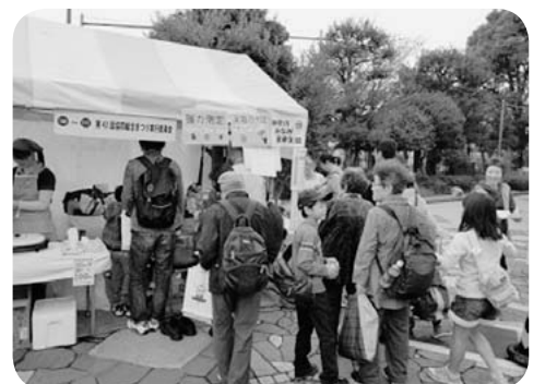
200名以上の測定者でした