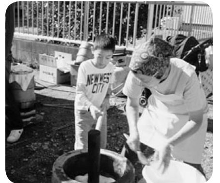
子どもも楽しんだもちつき