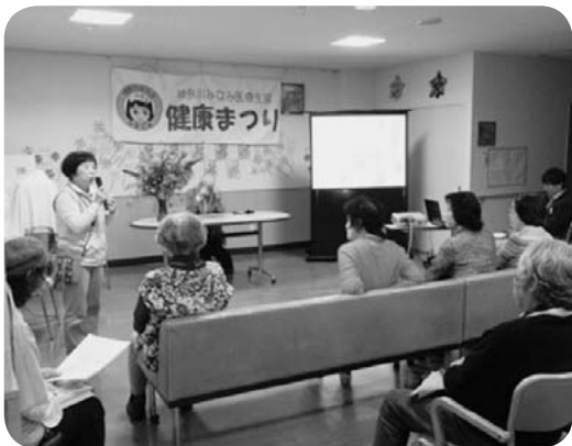
平野先生による講話