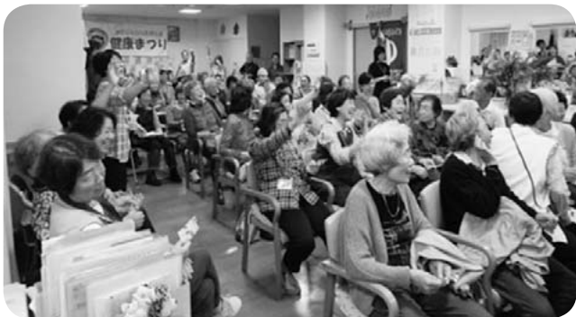
大盛り上がりのビンゴ大会