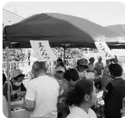
模擬店は完売御礼