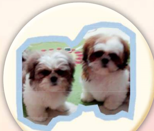
チロちゃん チヤちゃん