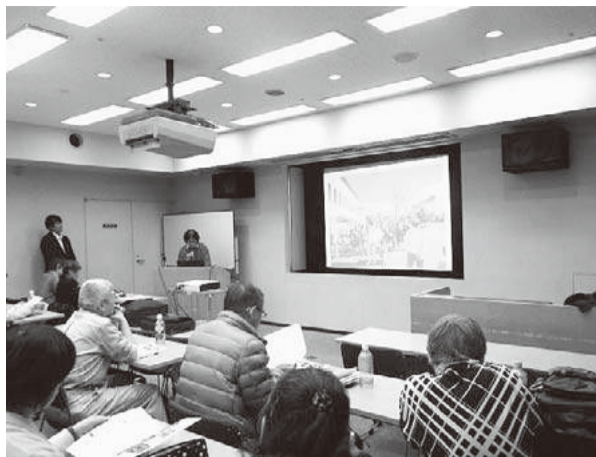
医療生協かながわの報告を聴講する参加者

援や介護サービスを利用しながら認知症や周辺症状に大きな変化はなく落ち着いて過ごされています。 家族は昼夜を問わないおむつ交換や食事などの対応に追われていますが、いつも生活の中心にはAさんがいます。何をするとともに丁寧な声かけをして、Aさんの意思を確認しながら接しています。食事や排せつはできるだけベッド上で行わないうように努め、家族の優しさにAさんも笑顔で「ありがとう」と答えます。