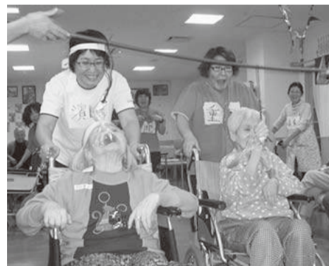
パン食い競争を楽しむ利用者

ない人もいて白熱した戦いでした。続いての仮装競争では、衣装の入った袋をバケツリレのように回してスタップが着替えていきます。今年は相撲力士に変身して大盛り上がり。ちなみに去年