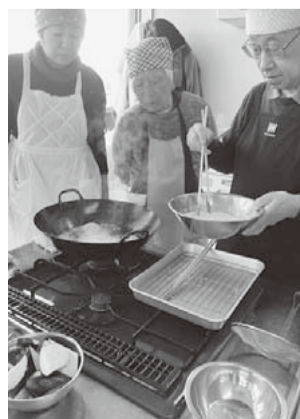
先生(右)が天ぷら手ほどき中

「食」を中心に仲間とふれあう楽しさが長く続いている理由でしょうか。150回、200回とこれからも「キッチンランパ」が記念日を迎えられますよう願いながら、美味しい料理で重くなったお腹を抱え帰途に着きました。(下)