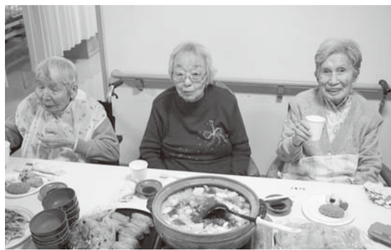
鍋を囲みながら楽しむ利用者

2017年最後のイベント「安楽楽 大忘年会」は、「忘年会をする機会がなくなった利用者だっ」て忘年会を楽しみたいはず」との考えから企画、日頃お世話になっているボランティアさんにも呼びかけ37名の参加者がありました。メニューの鍋・餃子は朝からみんなで頑張っ