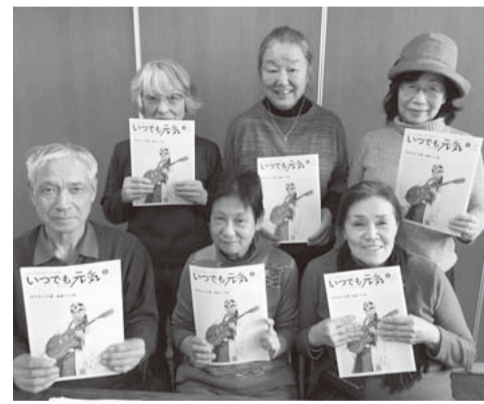
初声支部の担当理事と運営委員一同

初声支部では『いつでも元気』を運営委員一同が購読することになりました。『いつでも元気』という言葉は、わかれてピンとこない人もいるかもしれませんが、民医連が発行している月刊誌のことです。きっかけは購読を始めた1人の運営委員に、職員が運営委員会で渡した際、他の人から「それは何？」と質問があり、担当理事より「医療や介護の話題などが掲載されていて活動のヒントや情勢を知ること