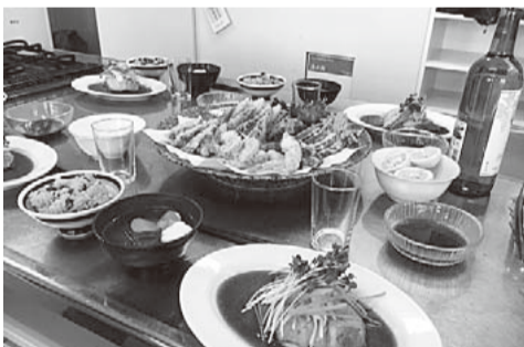
100回記念のスペシャルメニュー

100回目はおめでたくお赤飯にぶりのちり蒸し、天ぷら、菜の花の吸い物、そしてデザートに奥様の手作りケーキ(こちらプロ級)と