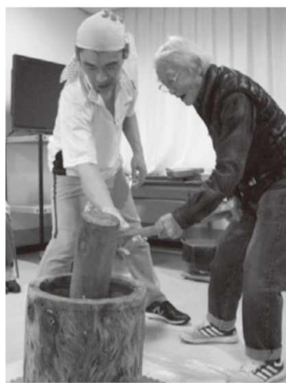
力強く餅をつく利用者さん