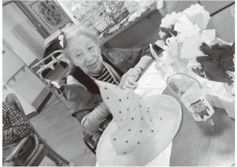
素敵な魔女に仮装した利用者さん

ハロウィン体験ではお菓子かごにおぼけのイラストを貼り、うさぎや猫の耳、こもりマント、海賊帽子、保安官バツジとスカーフと銃、魔女、ドレスなどに仮装をして、「ハッピーハロウィン」の掛け声とともにお手製のかごにお菓子を配りました。お菓子と一緒に紅茶を楽しんだ秋のお茶会を兼ねたハロウィンパーティーになりました。