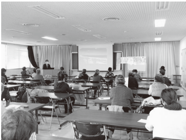
コロナ対策のため収容人数を縮小しての開催でした

資料のアンケートの結果では自宅が最期を迎えたいと答えた方が40%いましたが、自宅で最期を迎えるためにはかかりつけ医が必要で、死に場所を確保しないように看