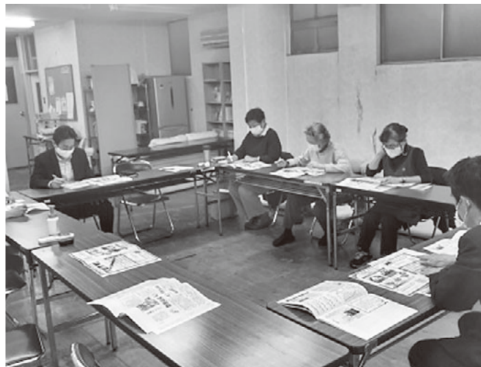
三浦市社会福祉協議会との懇談の様子

イベントや介護予防教室など多くの事業を展開していますが、コロナ禍で実施が困難であり、ネットでの情報発信も機器操作に苦手意識の高い高齢者が多く、十分に活用されていない現状とのことでした。市としては高齢化率県内1位の三浦市。施政方針に入れるほどフレイルチェックに積極的に取り組み、県内でチェック数が最も多かったということです。7月からフレイルチェックを再開。また