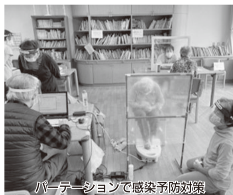
パーティションで感染予防対策