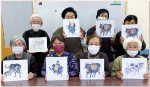
ひなの会のみなさん（南下浦支部） どれも素敵な牛ですね！

発行月 2021年1月 発行所 神奈川みなみ医療生活協同組合 横須賀市衣笠栄町2-19 TEL 046(853)8105 E-mail h-sosiki2@k-minami.or.jp URL http://www.k-minami.or.jp 編集 機関紙編集委員会