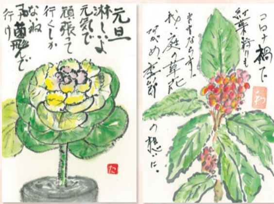
浦賀支部のみなさんの絵手紙