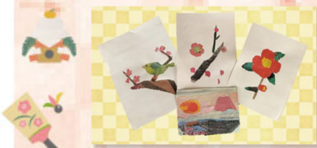
ちぎり絵班のみなさんの作品（葉山南支部）