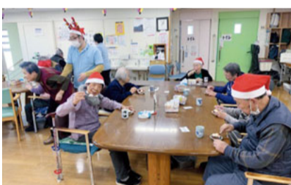
サンタさんやトナカイで楽しい雰囲気ですね

けたり工夫をして、クリスマス気分を感じてもらっていました。おやつはクリスマスにあわせて職員手作りのケーキでメリークリスマス。食べながらクリスマスソングを歌