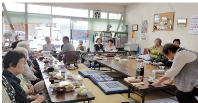
30年以上の歴史がある食事会

●勤務地: デイサービスみうら【三浦海岸駅徒歩2分】 デイ元気・ショートステイ安護楽 (夜勤アルバイトも募集)【葉山町 上山口小学校そば】 ●給与: 時給1020円~1240円以上(経験・資格評価、昇給あり) 夜勤アルバイト(勤務時間: 22:00~翌8:00) 20,000円/回 ★週1日よりOK 問合せ: 衣笠診療所 ☎046-851-1062 担当: 関