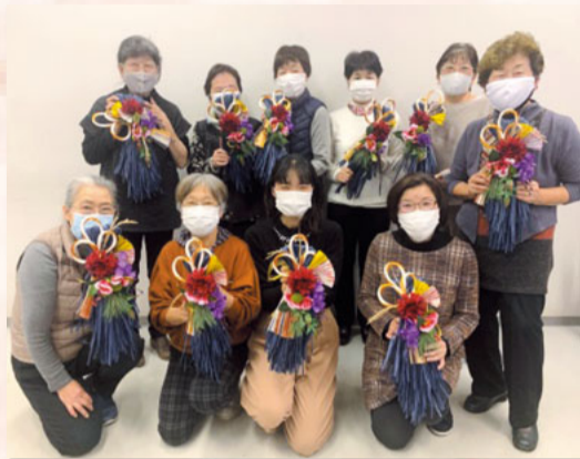
手作りの会のみなさん（追浜支部） 華やかな正月飾り