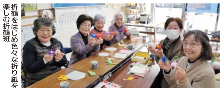
折鶴をはじめ色々な折り紙を 楽しむ折鶴班

平作阿部倉支部は衣笠診療所のある平作7丁目、をはじめ4・5・8丁目、しょうぶ園周辺の阿部倉