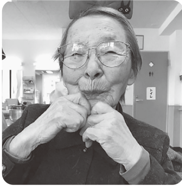
カラーでないのが残念。メイクで女子力アップ！

2月といえばバレンタインですね。そこでチョコバナナ作りをしました。しかし、バレンタインなどと言っても高齢者