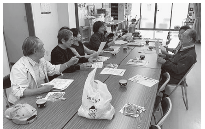
おしゃべり会は楽しい集まり

くれるみなさんがお元氣が心配です。早く開催をしてみんなで楽しくおしゃべりしたいですね。今年度は室内での企画が軒並み中止となったことから、3月に歩こう会の開催を予定しています。遠く