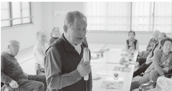
カラオケや体操もして、毎回時間はあっという間に過ぎます