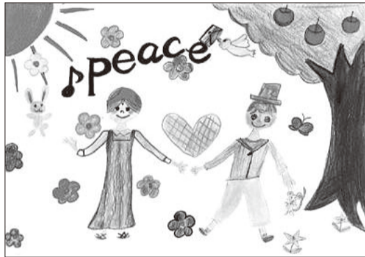
【最優秀】横浜市/ぴこ 【優秀】横浜市/らっち