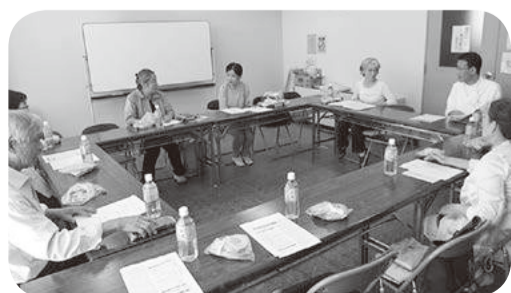
健診の大切さを改めて実感

話が聞け、質問をする時間もありません。先生からは健康診断の受診者を増やしていきたいという意気込みと、初声支部への激励の言葉もいただきました。