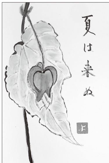
▲横須賀市/ヨコちゃん