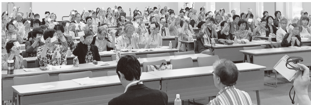
すべての議案を賛成多数で採択しました