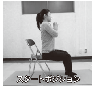
スタートポジション

ウエスト周りのシェイプアップ、内臓の血流を良くします。イライラするときや不安なときに、身体をねじることでリフレッシュをします。