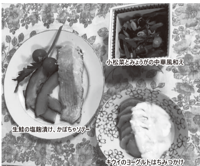
生鮭の塩麴漬け、かぼちゃソテー