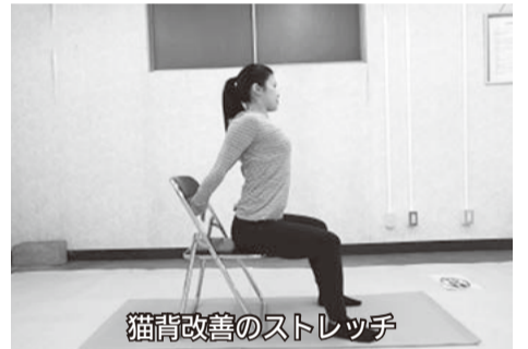
猫背改善のストレッチ