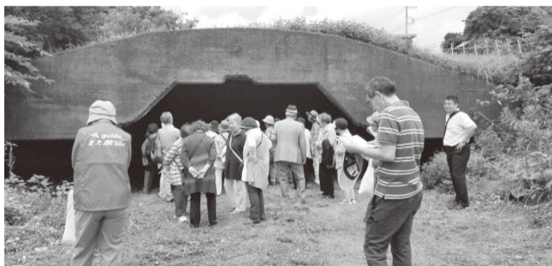
分厚いコンクリートで固められた戦闘機用の掩体壕

戦争を知らない親から生まれ、戦争を知るための遺跡なども相続などで取り壊されていくことや老朽化から保存が難しくなることなど、次世代に平和の大切さを繋げていくことがいかに大変なことかを学ぶことができました。(N)