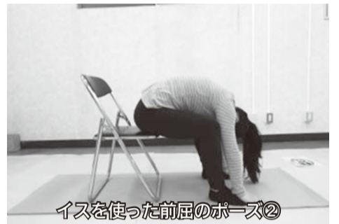
イスを使った前屈のポーズ②