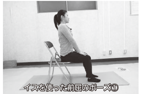
イスを使った前屈のポーズ①