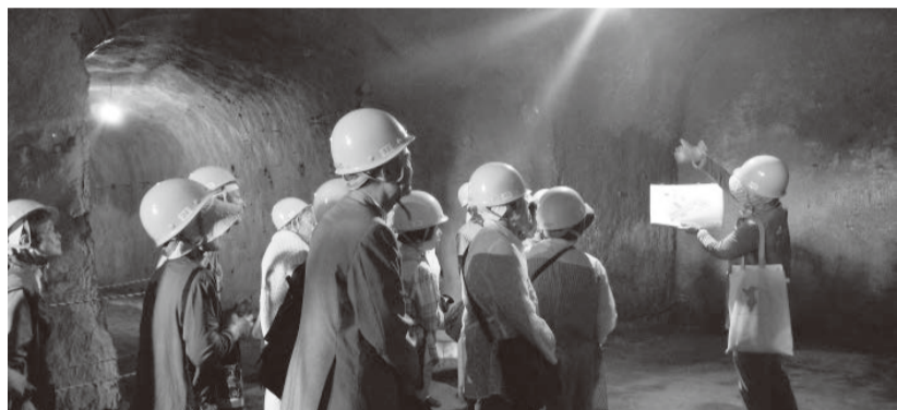
ガイドより説明を受ける参加者。安全のためヘルメットは必須

今回の「平和を学ぶバスツアー」で訪れたのは赤山地下壕跡。正式名称は、「館山海軍航空隊赤山地下壕跡」。全長約1.6kmもあり、全国的に見ても大きな壕ですが、資料が残されていないため謎多き場所です。建設時期ははっきりとわかっていないが、ガイドによると昭和10年代のはじめにつくられたという証言もある。しかし、大規模な地下壕が昭和16年の太平洋戦争開戦の前に掘られた例がないことや、建設に携わった館山海軍航空隊兵士たちによる複数の証言から昭和19年以降に建設工事が開始された説が有力で、昭和20年8月