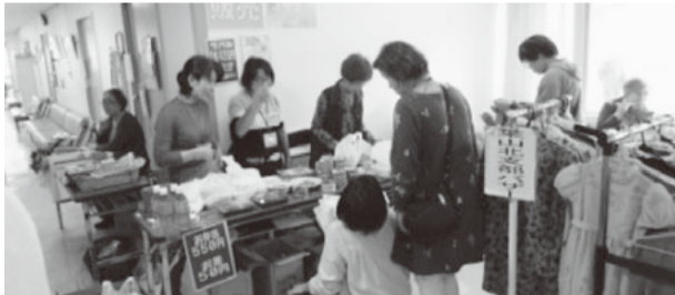
販売品も大盛況でした