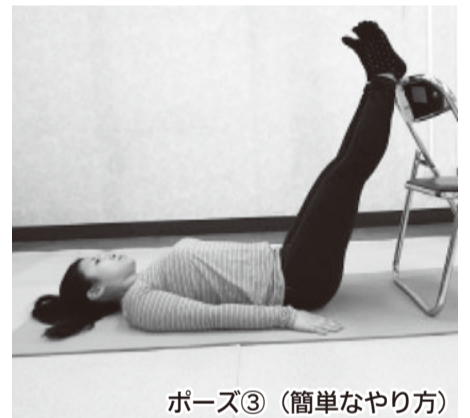
ポーズ③ (簡単なやり方)