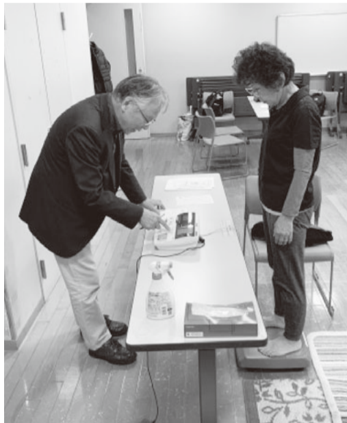
健康チェックにも取り組んでいます

曜午後健診を利用して送迎健診にも取り組みました。5名が参加をして、そのうち4人は地域に出向いてもらい12月に健診結果の説明を受ける予定です。