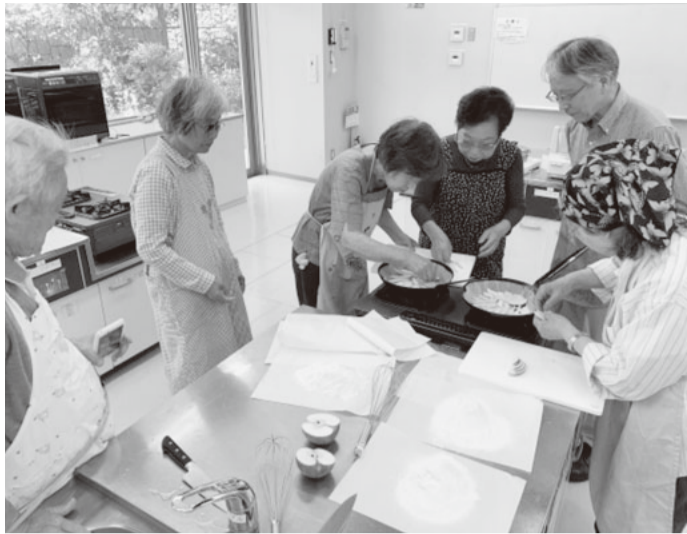
みんなで楽しくアップルケーキ作り