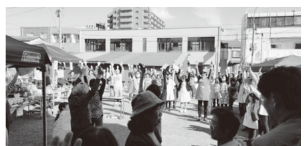
今年もオープニングは「みんなでラジオ体操」