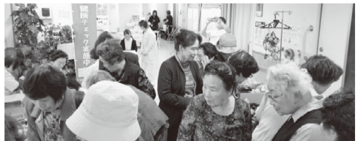
診療所内でのバザーや健康チェックも大好評