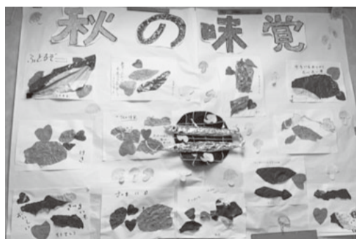
秋の味覚が並ぶ壁飾り

秋はたくさんのおいしいものがありますよ。利用者さんに思い浮かぶ物を聞くと、秋はさつまいも、芋の味がダントツ。そこで10月は「さつまいも団子」を作ることにしました。美味しい「さつまいも」の調理となれば女性たちは張り切ります。ですが、久しぶりに持つ包丁で切るので硬いさつまいもを切るのに四苦八苦。何とか潰して丸めて串に刺す。下準備の完了。主婦歴の長い女性陣から色々なアドバイスをもらいながら、こんがり焼き上がり、タレと黒ゴマをまとった団子が完成。「子供の頃に食べ過ぎてあまり好きではなかったけど、これは美味しいな」と美味しく食べる男性の利用者さん。久しぶりの「さつまいも団子」をみなさんが楽しんだ1日でした。