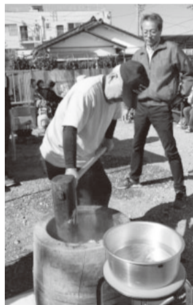
つきたてのお餅を配布、今年も大行列でした

今年もオープニングは「みんなでラジオ体操」。踊りやソーラン、コーラス、おもちゃつきで大盛り上がり。各ブース自慢の模擬店も大好評でした。エンディングは恒例のみんなで輪踊り。たくさんの催しで最後まで楽しんでいただきました。