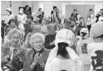
ひょっこり踊りを楽しむ参加者