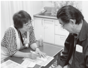
看護師から健康チェックの結果説明

毎年恒例の太鼓とひょっこり踊りで幕を開け、各支部の販売品や健康チェックでクリニックの中は久しぶりに人で賑わいました。みなさまありがとうございました。