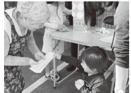
お楽しみ抽選会では子どもたちが大活躍