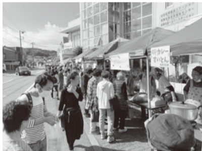
大人気の模擬店。美味しい料理に舌鼓

オープニングは恒例となっている平作お囃子連合による太鼓の演奏。オープニング終了後は各店自慢の模擬店販売開始。今年もあっという間に完売をしていきました。また、健康講話や抽選会も大盛況でした。フードドライブもお米などをいただくことができました。