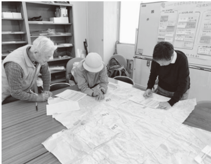
現在、長井地域の配達先の整理をしています

配達先の整理など少人数ですが色々と頑張っています。担当地域が広いので、一緒に楽しく活動してくれる人や機関紙の配達をお手伝いしてくれる人をたくさん大募集します。