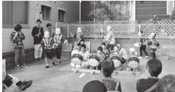
演奏にあわせてひょっこり踊りもしてくれました