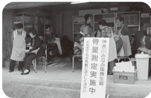
▲組合員宅ガレージにて

神奈川みなみ医療生協とともに、地域の皆さんに密着した事業を進めています！ 一般社団法人メディホープかながわ 045-624-8704