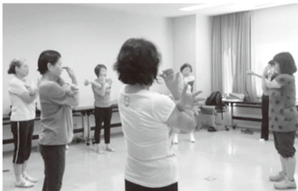
歴史が一番長い健康体操

イキングクラブ、手芸やお料理など多種多様な内容をしている「やさしい手作りの会」、月2回個人宅で行う「カラオケを楽しむ会」です。 班会を通して素敵な「おつきあいの輪」が広がっています。 コロナの影響で活動は厳しい状況ですが、感染対策をしっかり行つて、頑張っています。