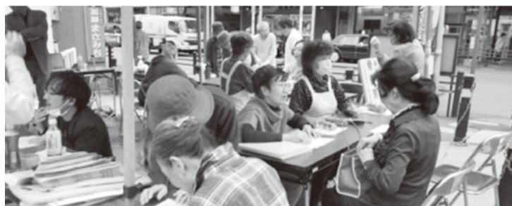
追浜駅前の街健は受付で加入の声かけ

追浜支部はこの診療所にも遠く、横浜市在住の組合員さんも多数います。したがって健診は送迎付きで実施しています。ただし、結果説明は追浜まで来ていただいで大好評です。 そんな訳で新しい加入者を増やすポイントは、年3回の街健と班会が中心です。 特に追浜駅近くの広場でを行う街健は通行中の人に呼びかけて、2時間で60人くらいの方が健康チェックを受けてくれます。医療生協を知っていただく最高の場になっています。