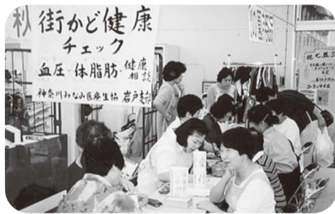
▲コープの店舗にて

数ある活動のなかでも医療生協といえばやっぱり健康チェック。いつ頃から始まったのかはわかりませんが、1975年(昭和50年)の機関紙にはブロック(現在は支部)活動で血圧チェックなどに取り組んでいた記事がみられます。街かど