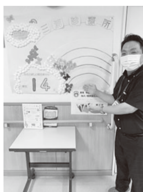
三浦診療所の素敵な掲示物

衣笠診療所では、医事課職員がみなみちゃんTシャツを着て強化月間をアピール。ネームタグにも増資を呼びかけるメッセージを載せています。三浦診療所では加入と増資の成果が見て分かるようにと、増資にあわせて喋々が飛ぶように工夫して月間を盛り上げています。