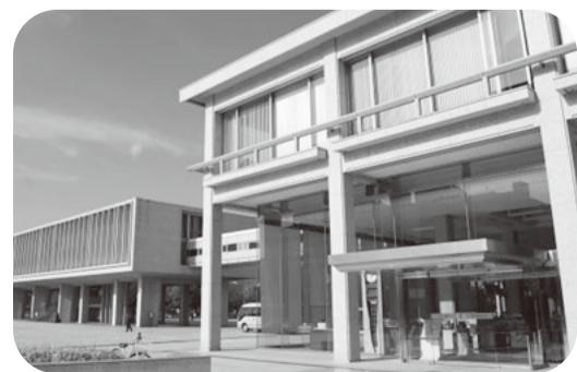
本来であれば見学をしていたであろう広島平和記念資料館。2019年にリニューアルした本館（写真左）