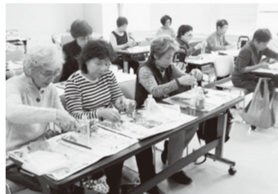
やさしい手作りの会でハーバリウム作成