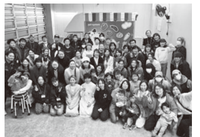
終了後、出店者で記念撮影

サリーなどの雑貨の販売のほか、リラクゼーションやワークショップなど幅広いジャンルのブースが出展。