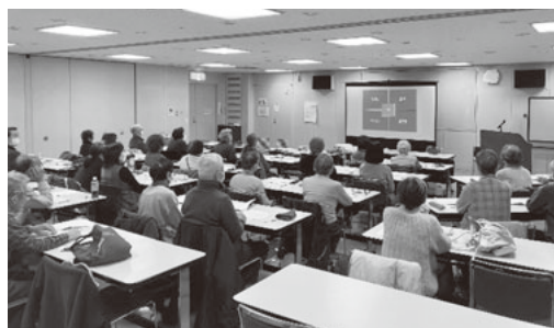
映像を見ながら楽しく検査できます。

1度におよそ100名まで検査することが可能で、この検査はDVDの映像を見ながら、ゲーム感覚で楽しく受けることができます。認知症の予防、早期発見のためにも、積極的に活用していきたいと考えています。