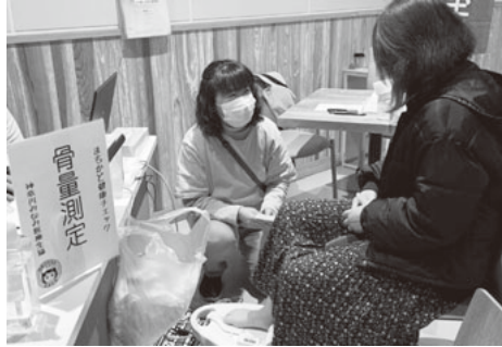
みなみ医療生協のブース

地域の中でそれぞれの生協が信頼しあい、協力しあっていつまでも安心して過ごせる地域社会を実現するために、横須賀市内で活動している生協（ユーコープ・パルシステム・うらがコープ・神