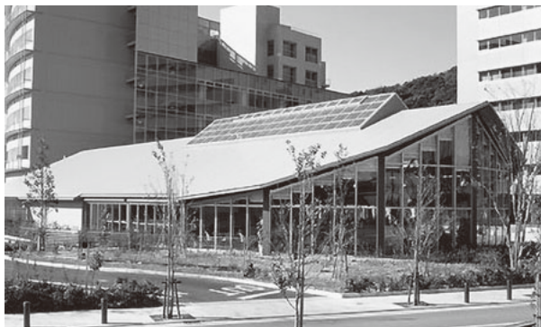
YRP内のレストラン「ローズテリア」

横須賀市南部、栗田、岩戸、野比などに隣接しているのが「光の丘」です。元々は山林地区でしたが1997年に情報通信の研究開発拠点として横須賀リサーチパークが開設され、公的な研究機関や国内外の民間研究機関が多数立地しています。電波情報通信から連想される地名として、「光の丘」となったとのこと。日本のシリコンバレーを目指しているそうです。光の丘のほとんどが、横須賀リサーチパークになっていますが、緑を残すという条件で開発が行われたため、光の丘公園、水辺公園など、広い公園が整備されています。