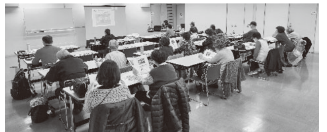
神奈川みなみは22名が参加

班での活動が進展し、地域のサロン活動との連携、モルックやウォーキング等のスポーツ活動、子ども食堂