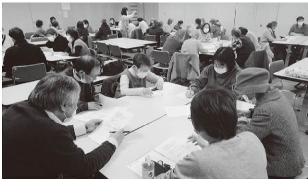
グループに別れて交流しました