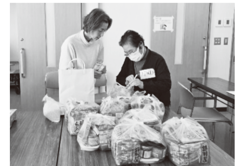
ケアマネージャーから支援物資をお届け

医療生協の活動の一つに助けあい活動があります。「困ったときはお互いさま」の助けあいの気持ちからたくさんのお米やレトルト食品、缶詰などの食料品や日用品、資金カンパなどを頂き、食料支援が実施できて