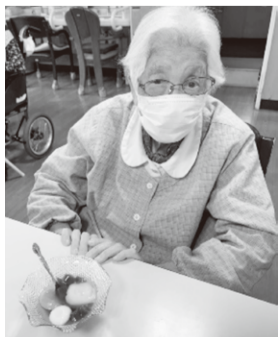
完成した3色団子あんみつ