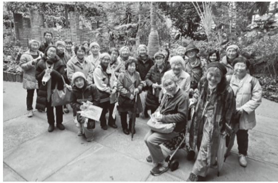
小田原フラワーガーデンにて

3月3日(火)当日は、予報通り最悪の雨の一日でしたが、キャンセルもなく出発。小田原フラワーガーデンでは、温室(トロピカルガーデン)内の珍しい花ヒスイカズラを見、園内の早咲きのおかめ桜や梅林を傘を手に散策しました。昼食後は漁港の駅TOTOOCO小田原や、小田原駅直結のミナカ小田原で買い物をしたり、屋上の足湯でのんびりして帰ってきました。屋食の刺身定食がとてもおいしく、並んだ小鉢も手が込んでいて大満足!中에서도定食に出された塩