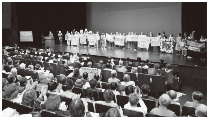
全体会の会場は満員でした

われ、2万3000人以上の避難者がいる。廃炉の見通しも立たず、地震大国の日本に原発はいらない。安全な原発などなく、原発再稼働は許せないとの訴えに、活動を広げていかなければと共感しました。