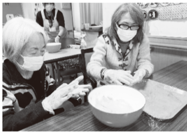
こねこね団子づくり