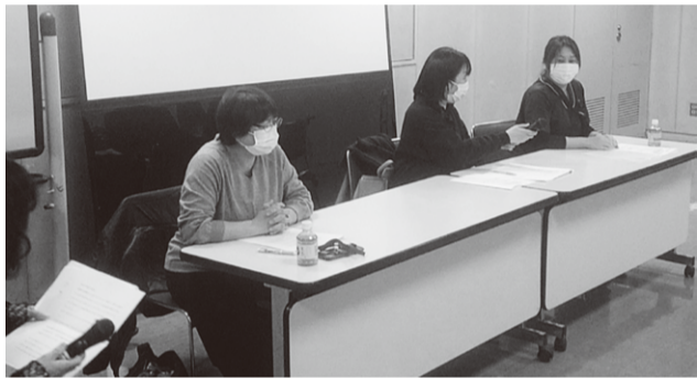
パネルディスカッションを実施

「患者さんに寄り添った看護をしている」「将来、みなみの看護師さんにお世話になりたい」などの嬉しい感想も頂きました。