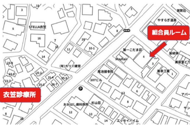
組合員ルーム (横須賀市平作 1-12-4 第二こだま荘1F)