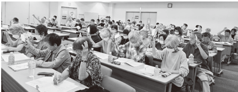
すべての議案が賛成多数で採択されました