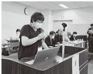
特別決議を決定しました