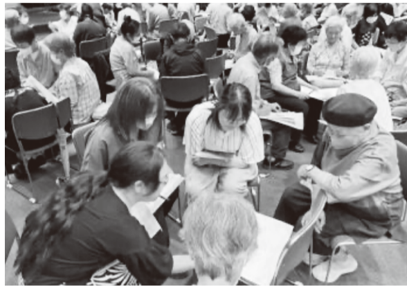
グループに別れてワークショップ

の医療生協と福祉クラブ生協の組合員を中心に190人が参加し、成功しました。神奈川みなみ医療生協からは26人が参加しています。