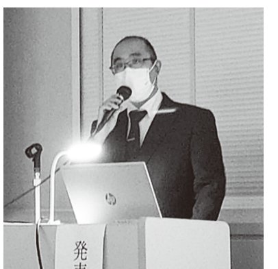
デイサービスみうら 大高主任の発表

から演題の報告があり、活発な意見交換が行われました。神奈川みなみ医療生協からも衣笠診療所・デイサービスみうら・