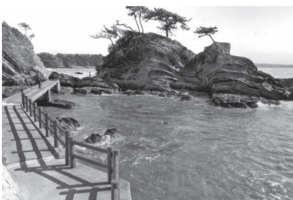
荒崎公園の遊歩道

販売されています。また、少し足を延ばせば、人気の「ソレイユの丘」にも立ち寄ることができます。一度訪れてみてはいかがでしょうか？